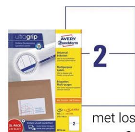
met losse vellen

Bij de dubbele A5 lay-out drukt u het door Palletlabel™ aangemaakte label één keer af en heeft u direct twee identieke A5 SSCC-labels. Deze bevestigt u aan twee zijden van de pallet.